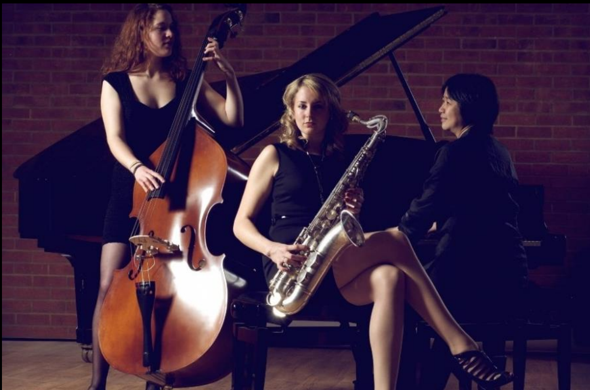
Bella Jazz Trio